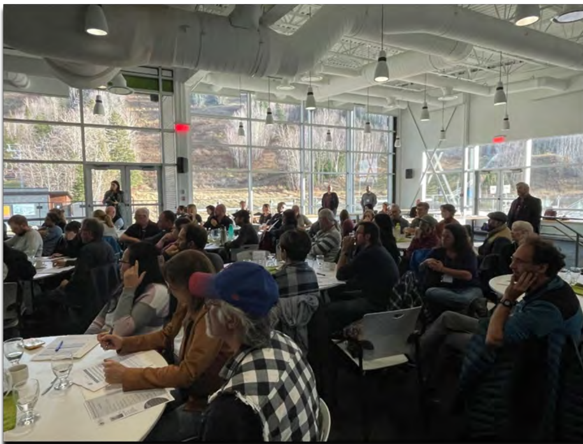
37 producteurs-transformateurs locaux, 14 marchés publics et 36 intervenants du milieu réunis autour des thématiques de la consolidation et du développement des marchés publics au Bas-Saint-Laurent.